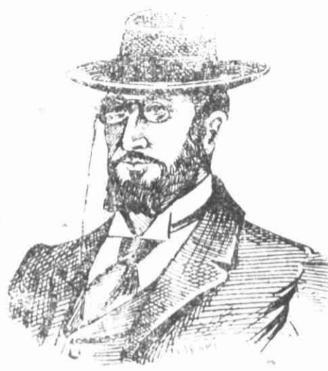
Miguel Angiolillo, que justicou Canovas del Casti-lho, o infame predecessor de Maura